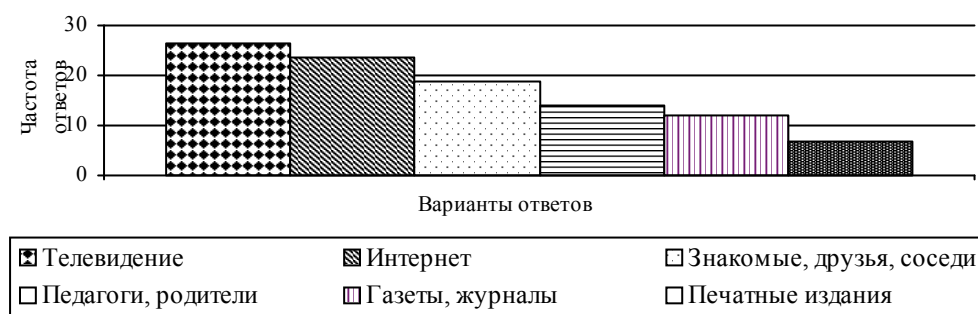
Рис. 1. Распределение источников информации о жизни современной молодежи с позиции респондентов (в процентах от числа опрошенных, n = 1000 )

Массовый охват молодежной аудитории СМИ подтверждается авторским исследованием (общий объем выборки составил 1000 человек, приняли участие респонденты обоих полов, из которых 495 юношей и 505 девушек, возрастные границы – от 15 до 18 лет, средних и высших учебных заведений г. Смоленска и г. Ярцево Смоленской области, исследование проводилось в 2009–2010 гг.). Респонденты указали на то, что они получают информацию о жизни современной молодежи через следующие источники: телевидение – 26,4 %; интернет – 23,6 %; знакомых, друзей, соседей – 18,8 %; педагогов, родителей – 14,0 %; газеты и журналы – 10,2 %, печатные издания – 7,0 % (рис. 1).